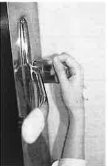
7. 水運の栓を止めるときは、手首が肘で止める。できないときは、ペーパータオルを使用して止める