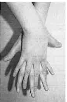
2. 手の甲を伸ばすように洗う