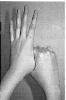
5. 親指と手掌をねじり洗う